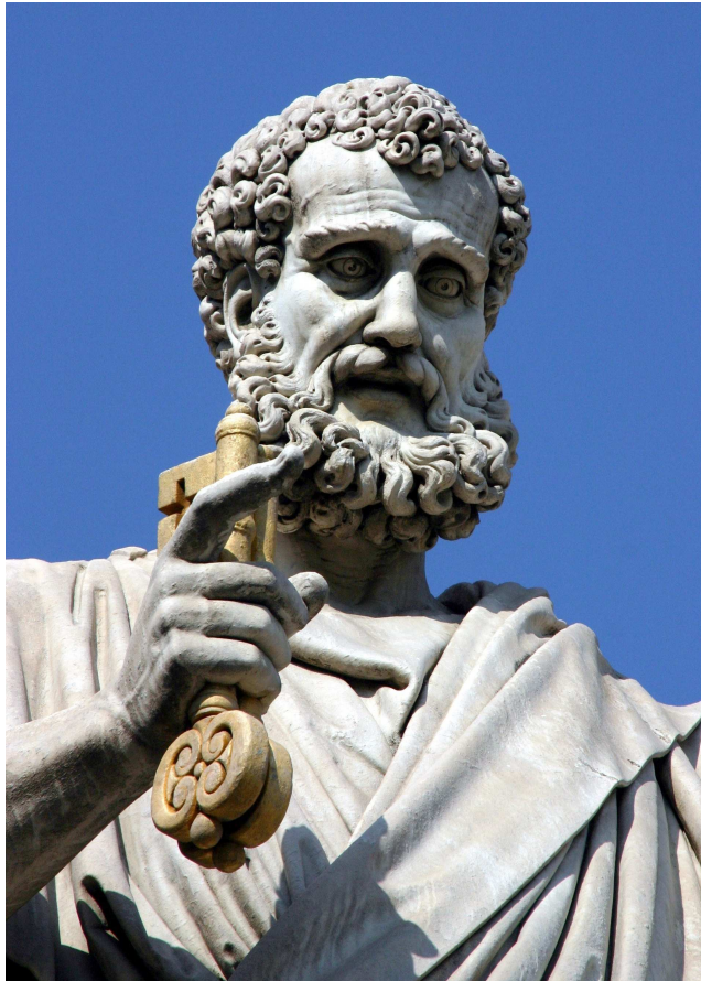
Św. Piotr, Watykan