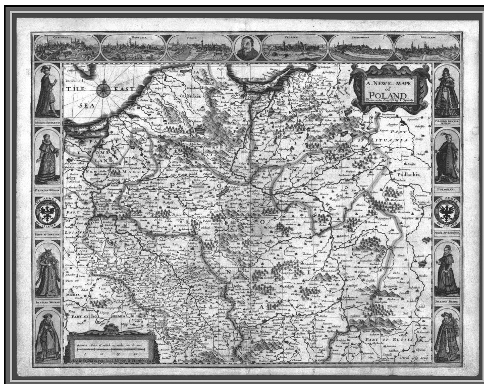
Mapa Polski z 1626 roku

Inaczej było podczas wojny z Kozakami Chmielnickiego w 1648 roku. Wtedy okrucieństwo i rzezie przerosły wszystko, co Rzeczpospolita wcześniej doświadczyła. Powstanie Chmielnickiego miało najpierw charakter wojny domowej, ale później przekształciło się w konflikt międzynarodowy, gdyż Kozakom przyszedł z pomocą chanat krymski, a następnie, mocą ugody w Perejesławiu (18 stycznia 1654 roku), podjęto decyzję o przyłączeniu Ukrainy do Rosji i wojnie z Rzeczypospolitą (wojna trwała do 1667 roku).