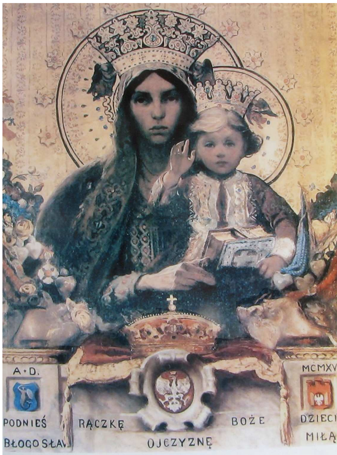
Włodzimierz Tetmajer, Matka Boża z Dzieciątkiem Kościół oo. Franciszkanów w Krakowie - Bronowicach Wielkich