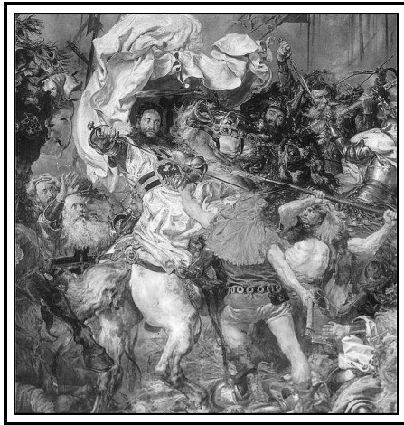
Jan Matejko, Bitwa pod Grunwaldem (fragment)

Także przebieg wojny krzyżacko-polskiej z lat 1409-1411 można uznać za zrzączenie Bożej Opatrzności. Do dnia bitwy pod Grunwaldem obydwa państwa: Polska i Litwa były zagrożone w swym istnieniu.