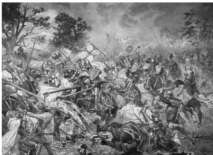
Wojciech Kossak, Bitwa pod Grunwaldem

Czy nie należy w tym widzieć działania Bożej Opatrzności?